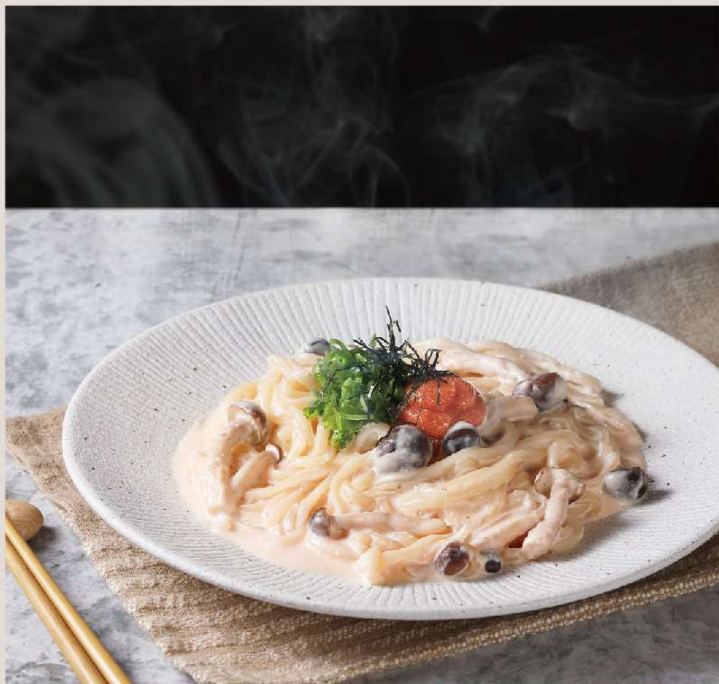
明太子クリームうどん $88