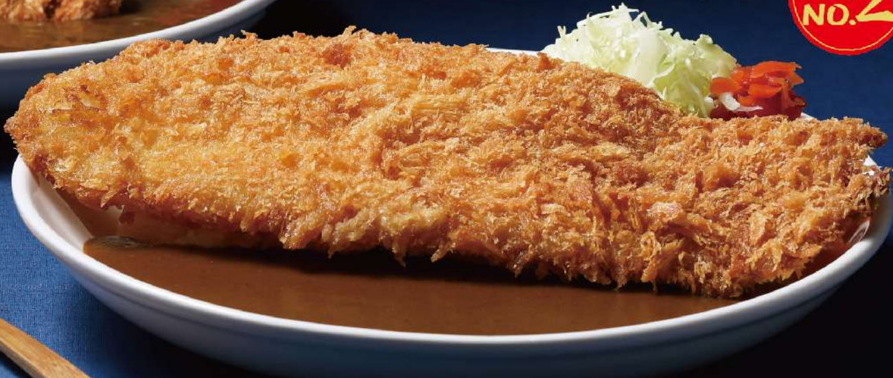
特大魚フライカレーライス $88 超巨型吉列魚柳咖喱飯 Giant Fish Fillet Katsu Curry Rice