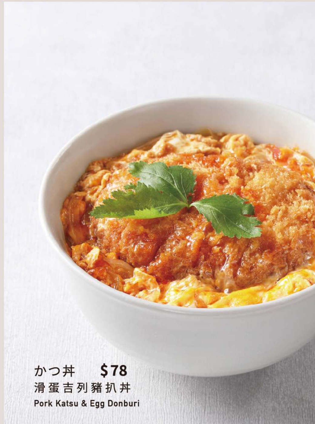
かつ丼 $78 滑蛋吉列豬扒丼 Pork Katsu & Egg Donburi