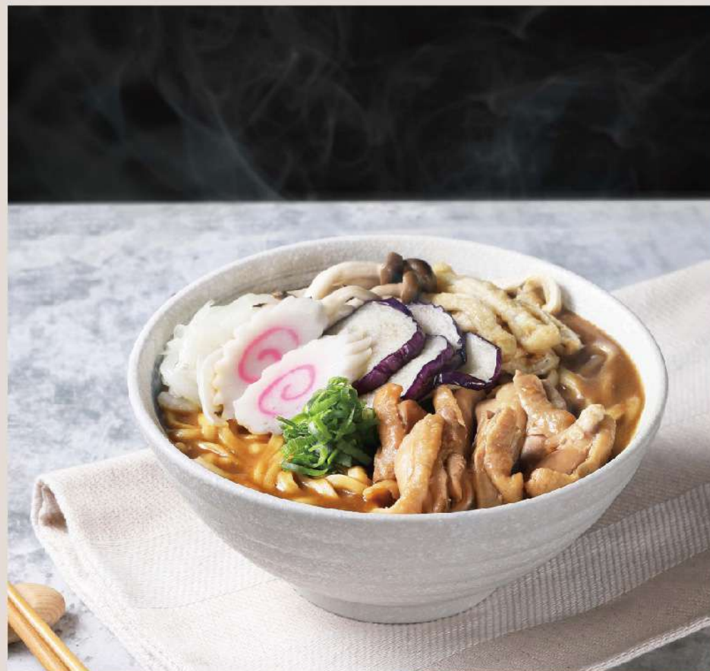
鶏肉カレーうどん $88