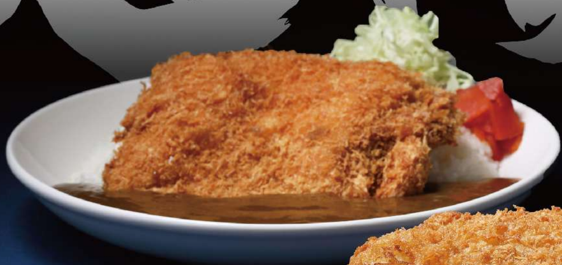
チキンかつカレーライス $78 巨型吉列雞扒咖喱飯 Giant Chicken Katsu Curry Rice