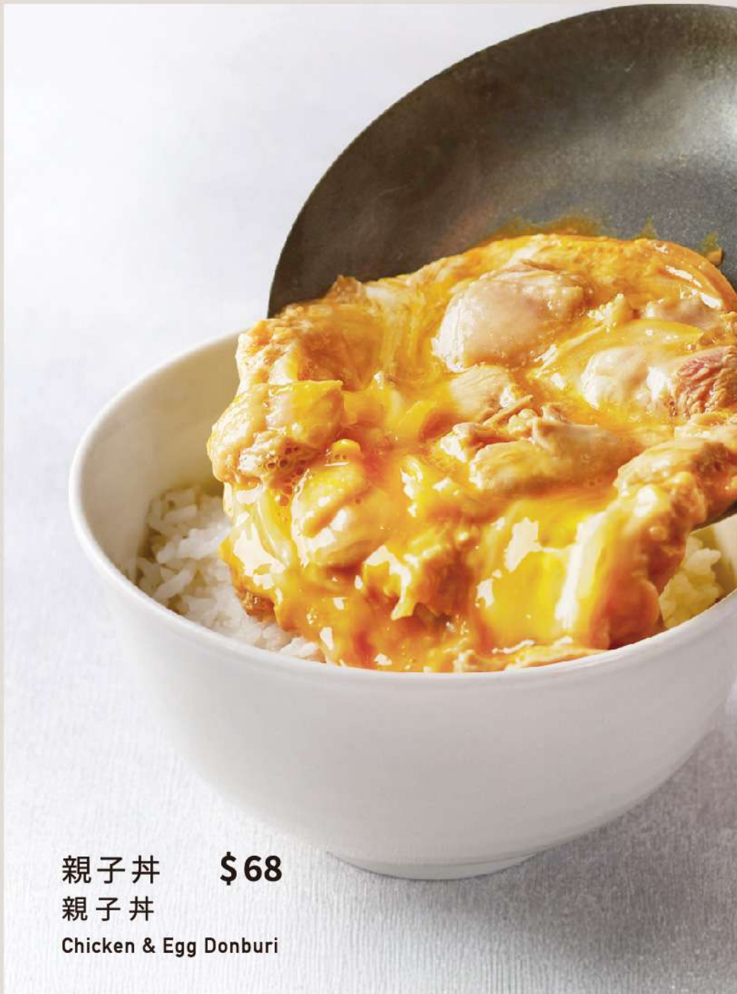
親子丼 $68 親子丼 Chicken & Egg Donburi